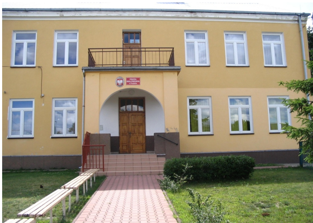
Rysunek . Publiczna Szkoła Podstawowa w Przędzeli

Dzieci z terenu miejscowości uczęszczają do Publicznej Szkoły Podstawowej w Przędzeli, która znajduje się przy ulicy Mickiewicza. Z usług edukacyjnych obecnie korzysta 102 uczniów, a kadra nauczycielska liczy 13 nauczycieli. Szkoła mieści się w 2 budynkach: w starym odbywają się zajęcia lekcyjne i znajduje się pracownia komputerowa, zaś w nowszym mieści się klasa „0”, świetlica oraz punkt wydawania posiłków. Największym problemem szkoły jest brak sali gimnastycznej i dlatego władze Gminy i Miasta Rudnik nad Sanem muszą podjąć działania zmierzające do wybudowania nowoczesnej sali gimnastycznej, dobrze wyposażonej w sprzęt sportowy. W szkole odbywają się systematycznie szkolne eliminacje do konkursów przedmiotowych, dzięki którym uczniowie z sukcesami kwalifikują się do eliminacji wyższych szczebli.