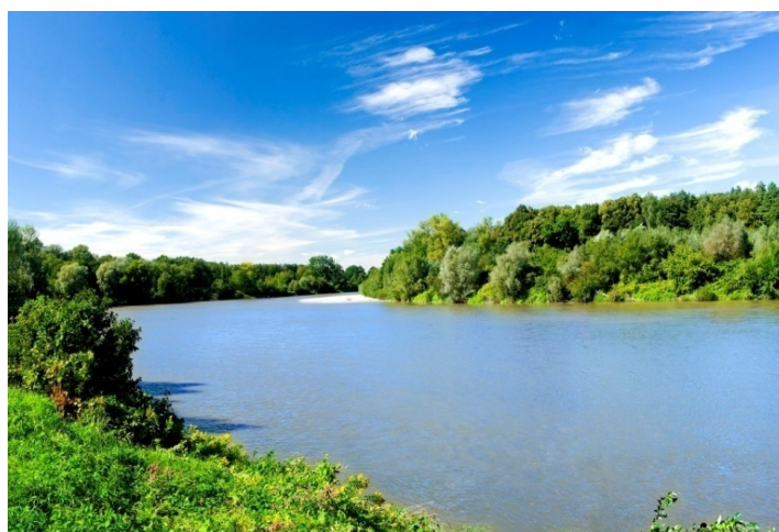
Rysunek . Rzeka San przepływająca przez Przędzel

Przez Przędzel przepływa rzeka San, która jest główną rzeką regionu oraz Stróżanka, stanowiąca dopływ Sanu. Obszar Doliny Środkowego Sanu został zaliczony do Krajowej Sieci Ekologicznej ECONET – POLSKA. Sieć ECONET-POLSKA istnieje od 1993 r. i obejmuje spójny przestrzennie i funkcjonalnie system reprezentatywnych i najlepiej zachowanych pod względem różnorodności biologicznej obszarów Europy. W jej skład wchodzi obszary, których walory przyrodnicze mają największą rangę.