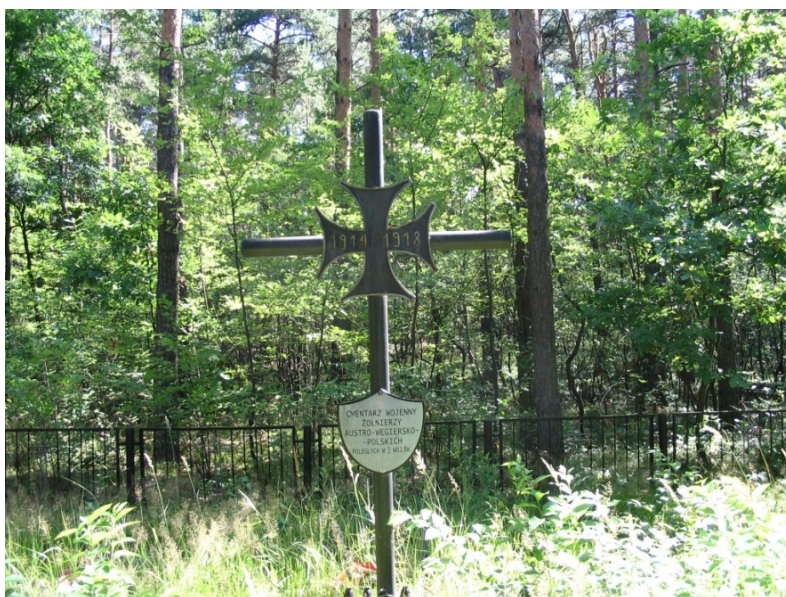
Rysunek . Cmentarz wojenny z okresu I wojny światowej