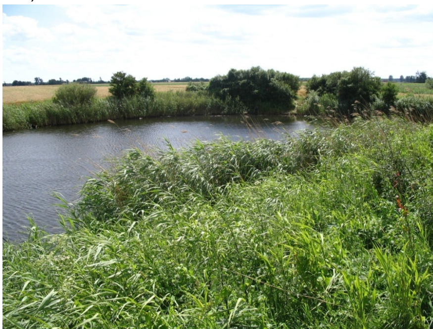
Rysunek . Chmurowy dół

miejszem tym związane są różne legendy i opowieści. Jedną z nich głosi, iż w miejscu tym w zamierzchłych czasach stała karczma. Przekleństwo rzucone na karczmarza i karcznię spowodowało jej zapadnięcie, a na tym miejscu został dół z wodą. Mieszkańcy opowiadają, że woda jest bardzo głęboka i nie ma dna. Wokół rosną trzciny i inne zarośla, wędkarze łowią ryby na pobudowanych pomostach. Woda jest ciemno-niebieska i bardzo zimna. Miejsce bardzo piękne, owiane tajemnicą.